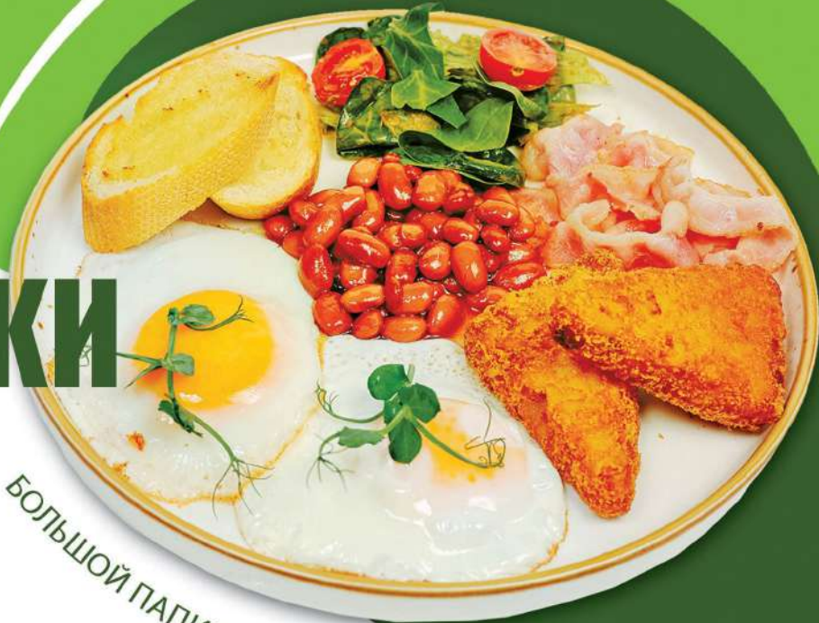
БОЛЬШОЙ ПАПИН ЗАВТРАК

БОЛЬШОЙ ПАПИН ЗАВТРАК 350гр 450 р. глазунья с беконом, хашбрауном, фасолью и тостом